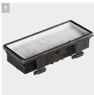
1 HEPA фильтр (EN 1882:1998)