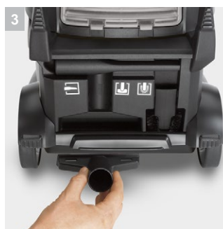
3 Интегрированный отсек для хранения аксессуаров